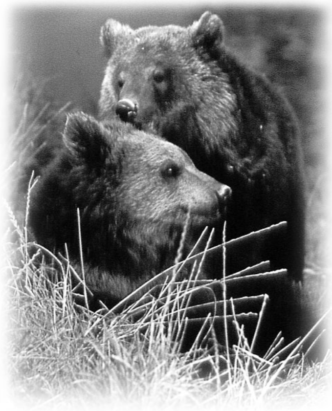
Een bruine berin met haar bijna volwassen jong.

Vroeger was het erg deftig om op beren te jagen: een echte sport voor koningen en presidenten . In 1902 ging Theodore Roosevelt, toen president van de Verenigde Staten , mee op berenjacht. Maar toen hij een zwarte beer voor zijn geweer kreeg, wilde hij niet schieten : hij vond het zo'n mooi dier. Amerikanen die dat hoorden maakten als dank een speelgoedbeer voor Theodore. Die beer kreeg de troetelnaam van de president: Teddy . Nu is de teddybeer niet meer weg te denken uit de speelgoedwinkel. Dat hij eigenlijk zwart en niet bruin moet zijn, weet bijna niemand.